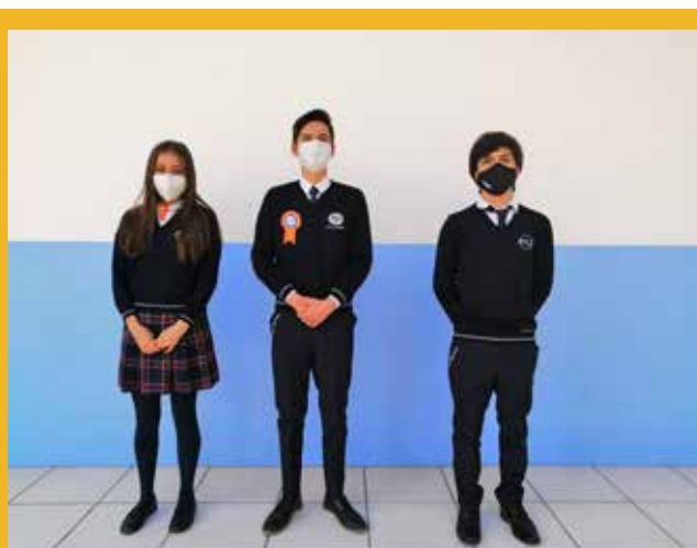
Lista VIBES 21