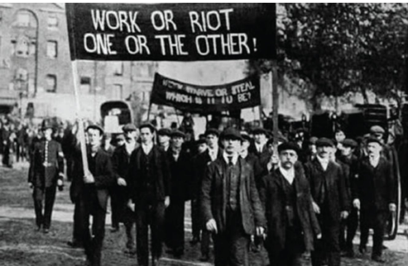
La revuelta de Haymarket en la que acusaron a los Mártires de Chicago