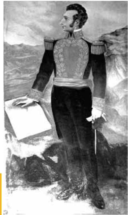
Enciclopedia del Ecuador

Para más información vista: https://enciclopediadehistoria.com/batalla-de-pichincha/