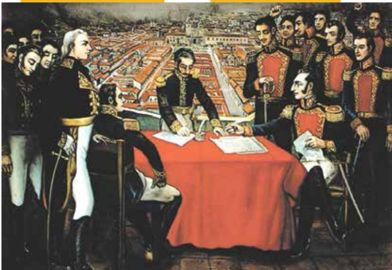
Enciclopedia del Ecuador

Este conflicto armado ocurrió el 24 de mayo de 1822, en las laderas del volcán Pichincha. Esta batalla selló la independencia del departamento de Quito (anteriormente llamado Real Audiencia de Quito), impulsando la independencia territorial.