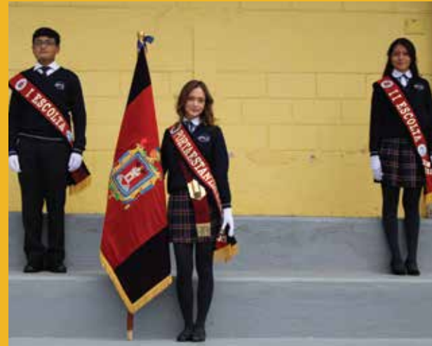
Pabellón del Plantel